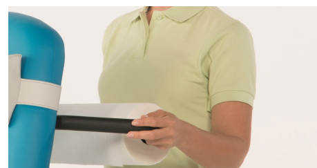
Skubbehåndtag med papirrulleholder