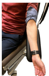
Armlæn til blodprøvetagning